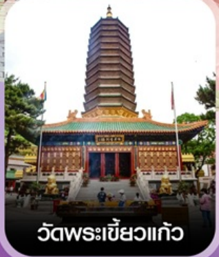
วัดพระเขี้ยวแก้ว