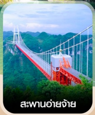
สะพานอ้ายจ้าย