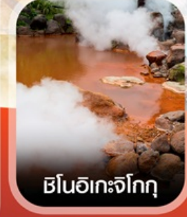
ฮีนอิเกะจิกุ

✈️ คอนเฟิร์ม ออกเดินทาง ✈️ ทุกพีเรียด 2 ท่านขึ้นไป