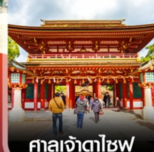
ศาลเจ้าตาไซฟุ