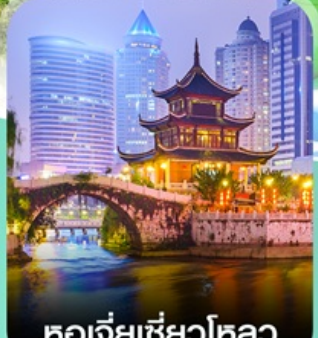
หอเจียเซียวไหลว