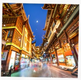
ตลาดเดินหัวงเมี่ยว