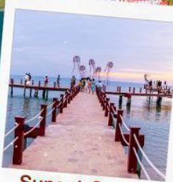
Sunset Sanato Beach Club