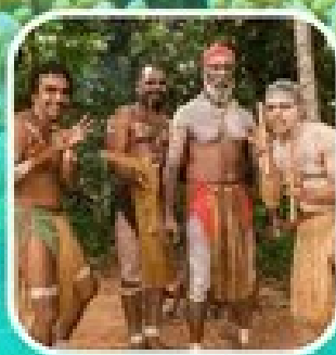
Rainforestation Aboriginal Show