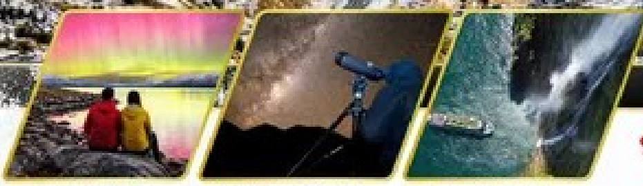
ตามล่าหาแสงใต้