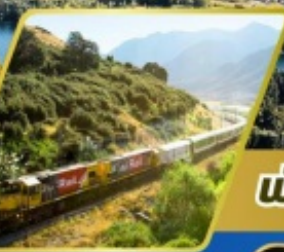
นักรดไฟฟราชนิ อิลไฟน์