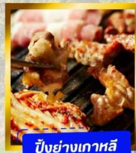
ปิ้งย่างเกาหลี