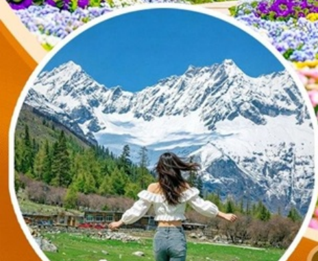
ภูเขาสี่ดรุณี ช่วงเลียวโกว (รวมรถอุทยาน)