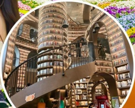
จงชู่เก้อ

สวนสวรรค์แห่งดอกไม้MANHUA-จงชู่เก้อ-จัตุรัสหย่างเกียมวู่-รูปปั้นแพนด้าเซลฟี่ เมืองโบราณกวนเซียน-อุทยานเขาสี่ดรุณี(รวมรถอุทยาน)-สะพานหนานเจียว เมืองลั่วไถ่-ตึกแฝด-SKP-วัดต้าจื่อ-ถนนคนเดินซุนซีลู่-IFS-ตงเจียวจี้จี้-ถนนคนเดินไท่กุหลี่