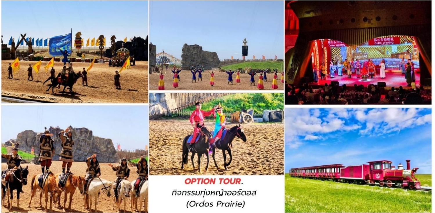
OPTION TOUR.. กิจกรรมทุ่งหญ้าออร์ดอส (Ordos Prairie)

บ่าย สมควรแก่เวลา นำท่านเดินทางกลับสู่ เมืองออร์ดอส ใช้เวลาเดินทางประมาณ 2 ชั่วโมง