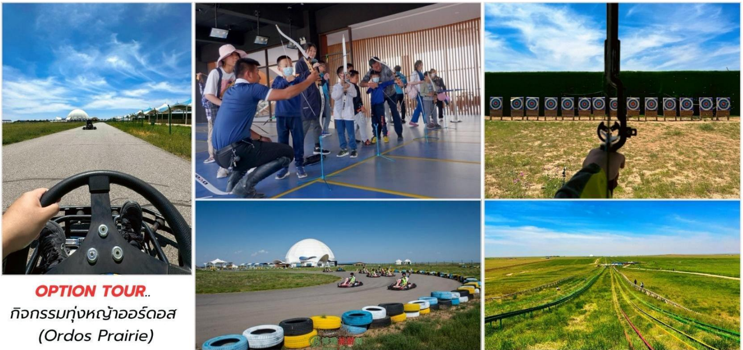
OPTION TOUR.. กิจกรรมทุ่งหญ้าออร์ดอส (Ordos Prairie)