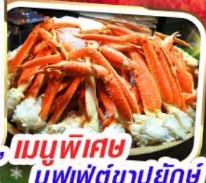
เมนูพิเศษ บุฟเฟ่ต์ขาปูยักษ์