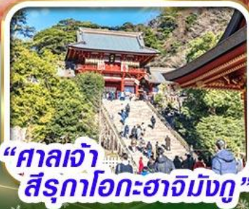
“ศาลเจ้า สึรุกะโอกะฮาจิมันงู”