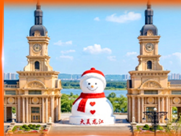
ตึกตาสหิมะยักซ์ ฮาร์บิน