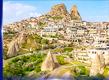
หุบเขาอูซึซาร์ คัปปาโดเกีย