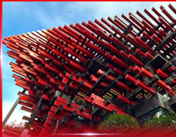
แลนด์มาร์คฉงฉง ตึกตะเกียบ