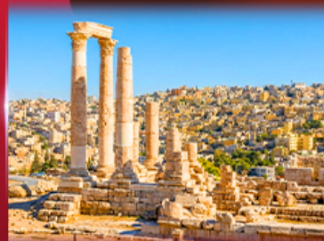
ปิอัมปราการัฒมาน