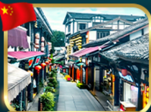
หมู่บ้านโบราณฉือซื่อ

เที่ยวอุทยานหลุมพี้สะพานสวรรค์ + เขานางพี้