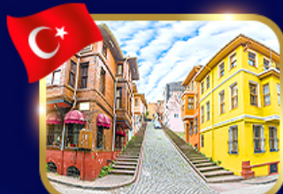
ชมบ้านหลากสี ย่านบาลิก