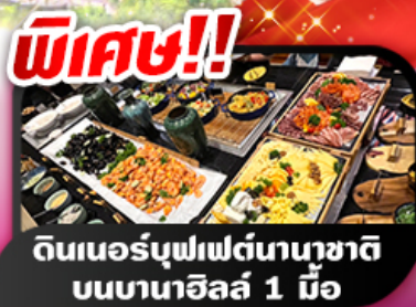
พิเศษ!! ดินเนอร์บุฟเฟต์นานาชาติ บนบานาฮิลล์ 1 มื้อ

เที่ยวฟิน 3 วัน 2 คืน ๓.ค. - ๓.ย. 68 เริ่มต้น