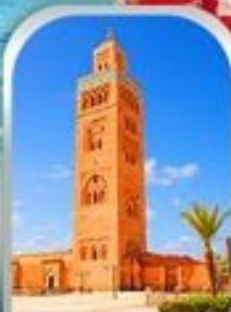
JEMAA EL-FNAA MARRAKESH