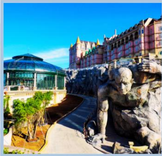
โซอู Eclipse Square