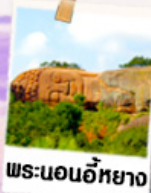
พระนอนอภัย