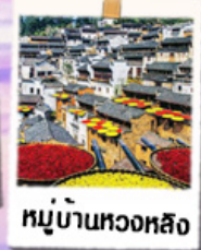
หมู่บ้านทวงหลิ่ง