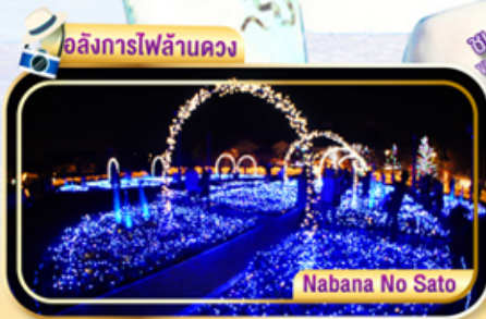
Nabana No Sato