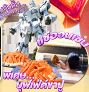
ซุกกินดื่ม... ซุกกินซุกดื่ม พร้อมดื่ม พร้อมกิน