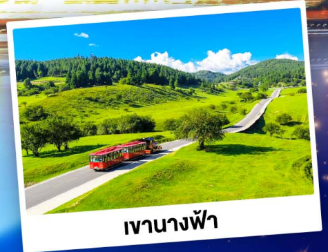
เจานางฟ้า