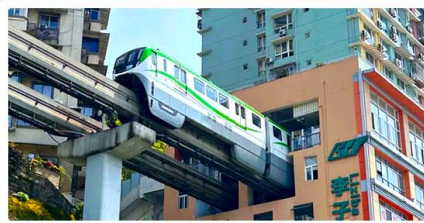
รถไฟฟ้าสุดคึก