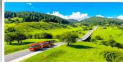
เหนานางฟ้า

เดินทางโดย: สายการบินฉงชิ่งเจียงเป่ย์ (PN)