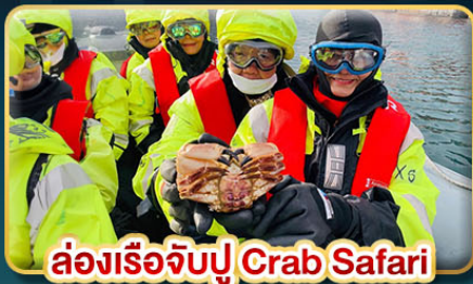
ล่องเรือจับปู Crab Safari

📅 เดินทาง: 08-16 ต.ค. | 07-15 พ.ย. 30 พ.ย. - 08 ธ.ค. 69