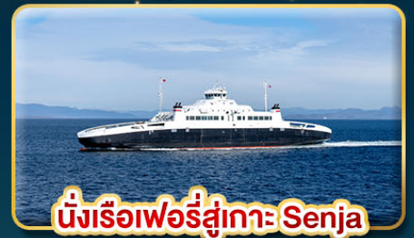
นั่งเรือเฟอร์รี่สู่เกาะ Senja