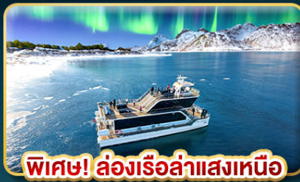
พิเศษ! ล่องเรือล่าแสงเหนือ