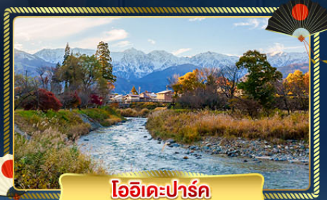
โออิเดะปาร์ค