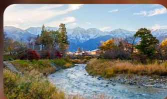
โออิเดะปาร์ค