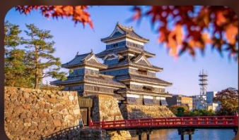
ปราสาทมัทสึโมโต้