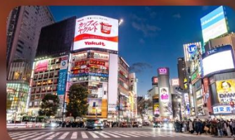
ซ้อปปิ้งชินจูกุ