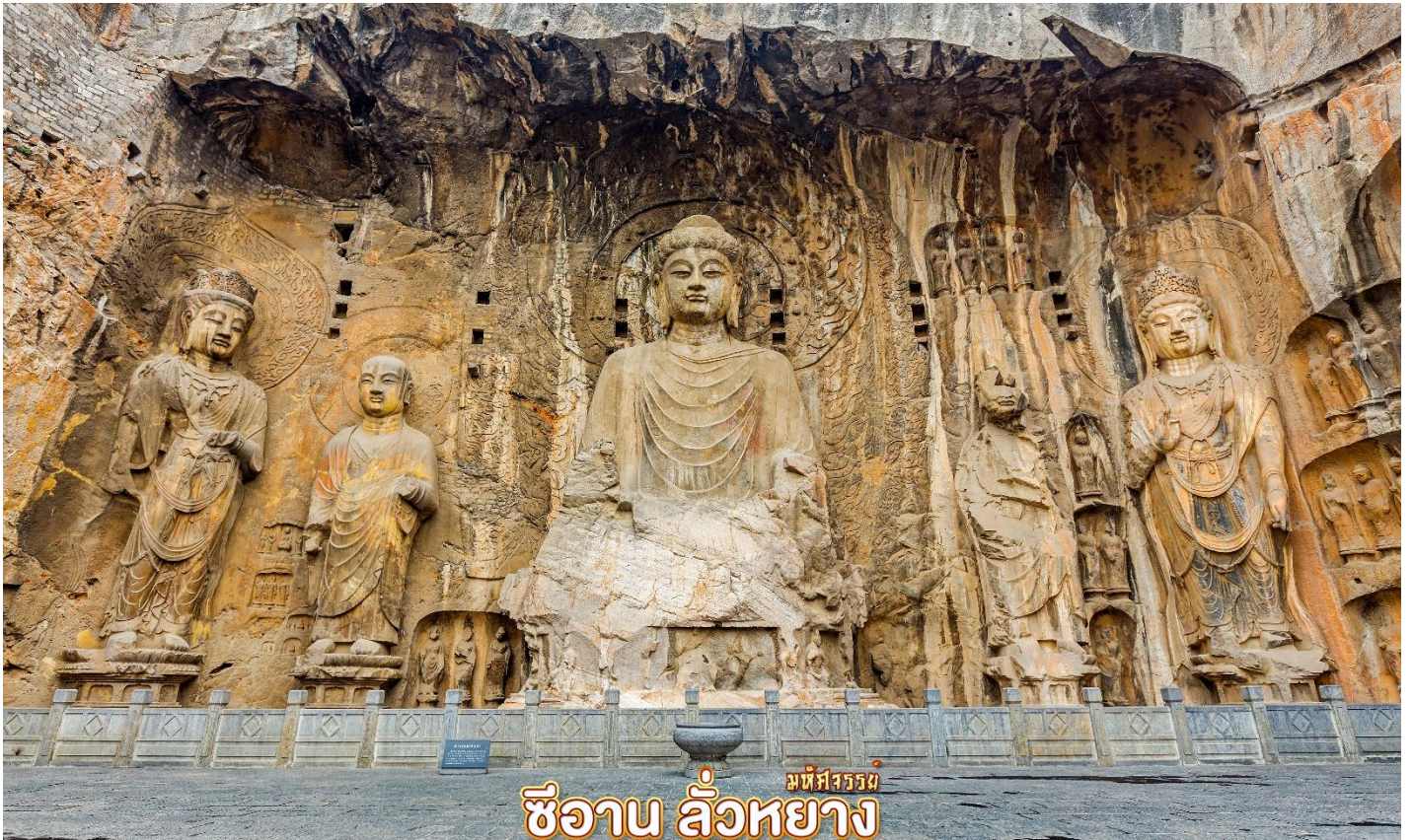
มที่พรพรหม ซีอาน ลั่วหยาง

ตั้งอยู่บนผาสูง 40 เมตร มีพระพุทธรูปองค์ประธานนามว่า ‘พระโพธิสัตว์ไวโรจนะ’ มีความสูงถึง 17.14 เมตร ความโดดเด่นอยู่ที่ดวงตาที่ดูเหมือนว่า ไม่ว่าจะยืนอยู่ตรงไหนดวงตานั้นก็ยังคงมองเห็นอยู่ ซึ่งพระประธานองค์นี้เชื่อว่าแกะสลักเป็นรูปพระพักตร์ของ ‘พระนางบูเช็กเทียน’ จักรพรรดินี (ฮ่องเต้หญิง) องค์แรกและองค์เดียวที่ได้รับการบันทึกไว้ในประวัติศาสตร์จีน