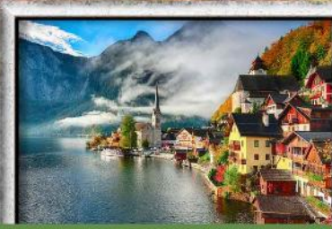
พัก Hallstatt / St. Wolfgang หรือริมนทะเลสาบ 1 คืน

พิเศษ!! ลิ้มลองเมนูประจำชาติ ทั้ง 5 ประเทศ!!!