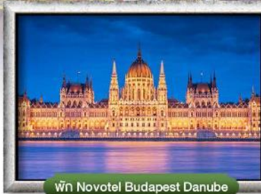
พัก Novotel Budapest Danube