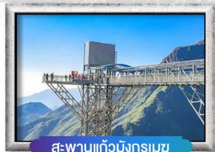
สะพานแก้วมังกรเมฆ