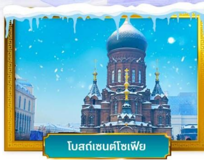
โบสถ์เซนต์ไอแซค