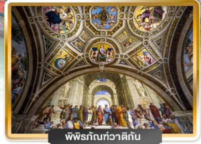
พิพิธภัณฑสถาน