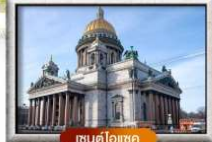
เซนต์ไอแซค