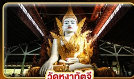
วัดหงส์ทิพย์