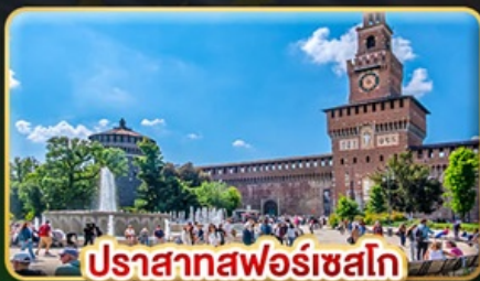
ปราสาทฟอรเซสโก

📅 เดินทาง : 28 พ.ค. - 06 มิ.ย. | 05-14 ส.ค. 15-24 ต.ค. 69