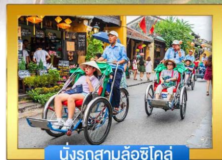
นั่งรถสามล้อซิโคล