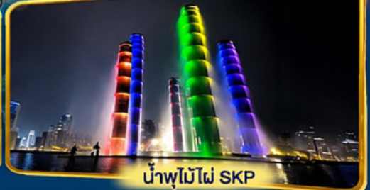
น้ำพุไม้ไฟ SKP