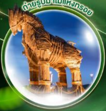
ถ่ายรูปล้ำไม้แห่งทรอย