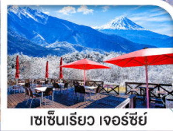
เซชินเรียว เจอร์ซีย์

หมู่บ้านมรดกโลกชิราคาวาโกะ | ชมวิวฟูจิ ริมทะเลสาบคาวากูจิ เซชินเรียว เจอร์ซีย์ ระเบียงชมวิวภูเขาไฟฟูจิและเทือกเขาแอลป์