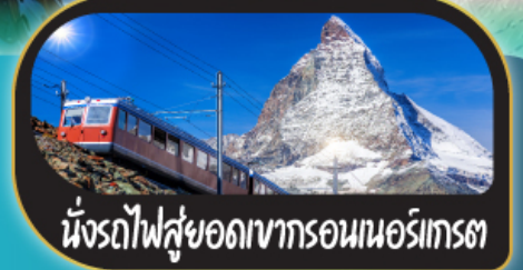
นั่งรถไฟสู่ยอดเขากรอนนอร์เกรต