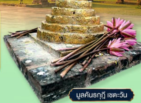
มุลคันรฤฎี เขต-วัน