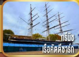
กรีนวิช เรือคัตตีซาร์ก