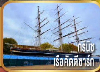
กรีนวิช เรือคัตตีซาร์ก

ชมเมืองลิเวอร์พูล พร้อมถ่ายรูป หน้าสนามแอนฟิลด์