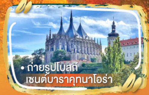
• ถ่ายรูปโบสถ์ เซนต์บารุกนาโอรา