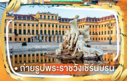
• ถ่ายรูปพระราชวังเชิร์นบรุน