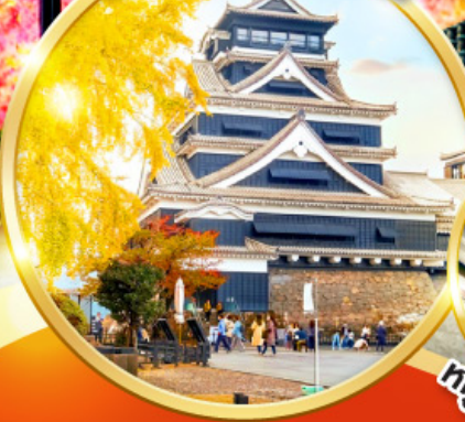
ปราสาทคумаโมโตะ