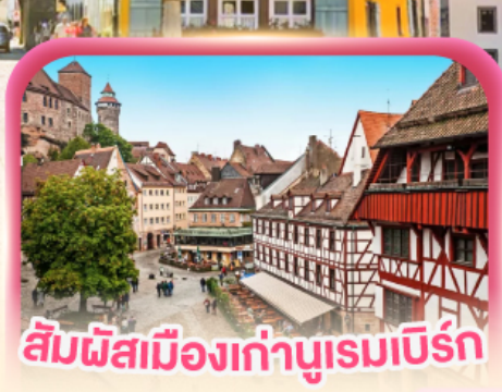
สัมผัสเมืองเก่าบูเรมเบิร์ก