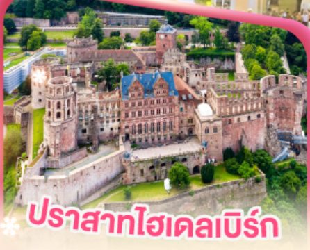
ปราสาทโฮเดลเบิร์ก