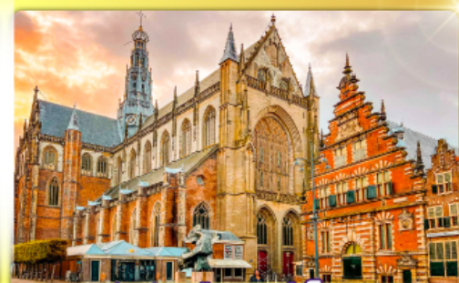
จัตุรัสเมืองฮาร์ลิม

พรมแดนเมืองเปลกาเนเธอร์แลนด์และเบลเยียม เดินเมืองเคลฟท์ เมืองเครื่องปั้นดินเผาระดับโลก ฮาร์ลิมเมืองมั่งคั่งที่สุดของเนเธอร์แลนด์