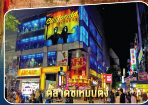
ตลาดซีเหมินตง