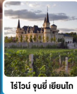
ไร่ไวน์ จุนยี่ เยียนโก