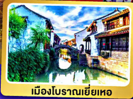
เมืองโบราณเยี่ยเหอ