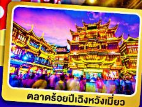
ตลาดร้อยปีเจียงหวงเมี่ยว