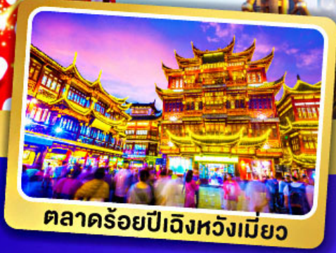
ตลาดร้อยปีเจิ้งหวังเมี่ยว