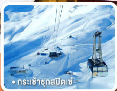
กระเช้าชุกสปีตเซ